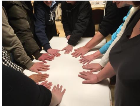
Samen een kunstwerk maken voor de cultuurweek.

Er waren wel al plannen gemaakt om met de beide Buurtcirkels activiteiten te gaan ondernemen, de eerste gezamenlijke activiteit zou het bezoeken van 'Kom in kas' zijn maar helaas ging dit ook niet door. Zodra we weer samen kunnen komen pakken we de draad weer op!